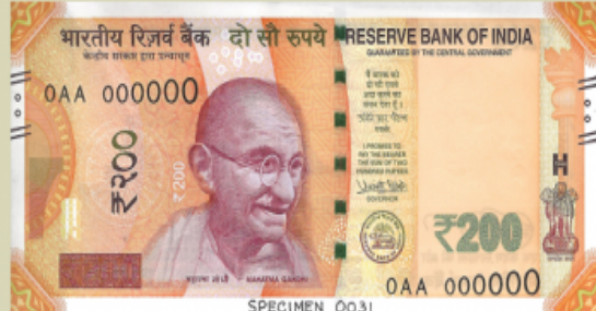
Rupees Two Hundred