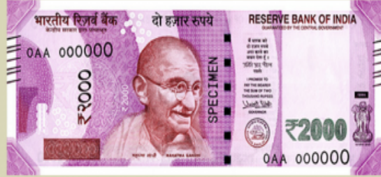
Rupees Two Thousand