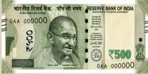
Rupees Five Hundred